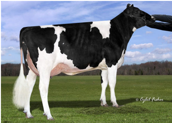
SIEMERS DENVER PARIS FOURTH DAM